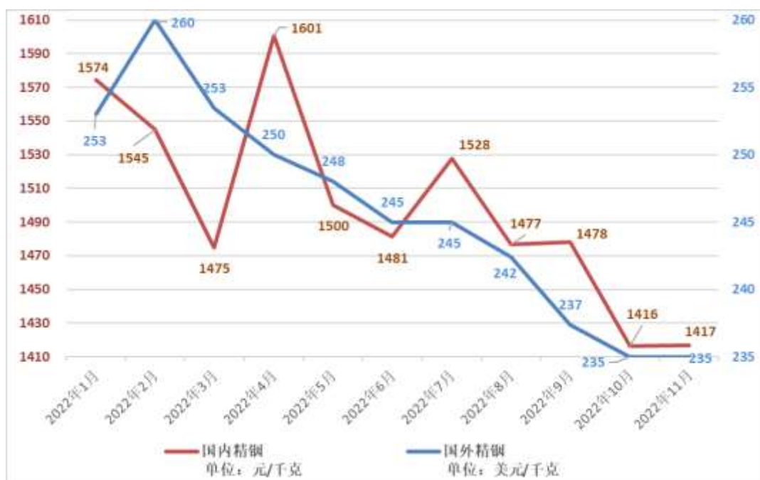
图 1-1：2022 年 1-11 月国内外精钢价格走势

2022年11月安泰科精钢报价均价为1417元/千克，同比减少15.41%，环比增长0.04%。2022年11月国外精钢报价均价为235美元/千克，同比减少15.16%，环比不变。